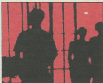
El alemán Factor.

El Ministry tiene un club virtual para los que viven lejos o no consiguen entrar, ya que es famoso por su puerta dura y su estricto código estético de admisión. Música y voces de mujeres, que se suponen fascinantes, acompañan al cliente por esta enorme página que ofrece música en directo los