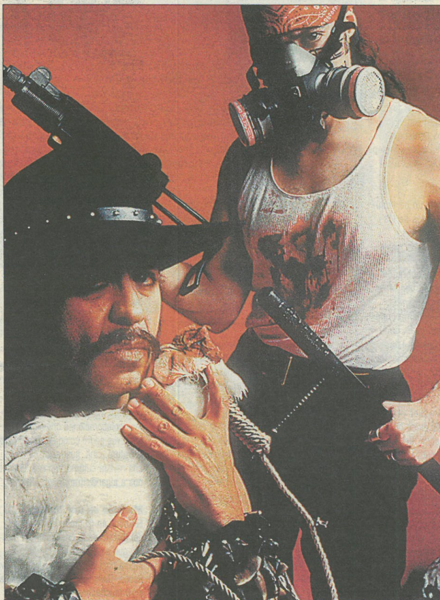
Los artistas Gómez-Peña y Sifuentes, reconvertidos en chicanos 'cyborgs'.

A la espera del Love Parade de Berlín, con un millón de personas, Sónar espera 40.000 jóvenes. En la edición anterior, visitaron la web 19.563 internautas (65% españoles, 9% estadounidenses, 7,5% franceses, 7% alemanes). Páginas 14 y 15