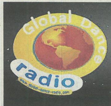
El holandés GDR.

mo en la realidad. Además de ofrecer una visita virtual con imágenes, la página realizada por Mubimedia (presente en SonarMática), publica un diccionario de pinchadiscos y otro de terminología tecno que ayudan a comprender a los personajes y las tendencias de una cultura cada vez más diversifi-