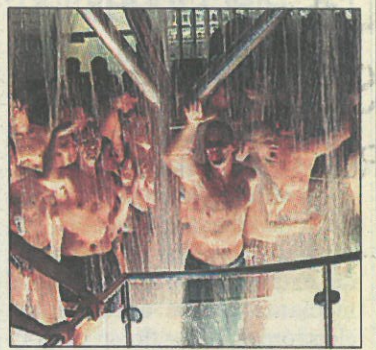
Nature One, en Coblenza.

entraron en la página 19.563 internautas, de los que el 65% eran españoles, el 9% estadounidenses, el 7,5% franceses, el 7% alemanes, el 6% belgas y el 5,5% de otros países. En total, 2.260 siguieron los conciertos por Internet.